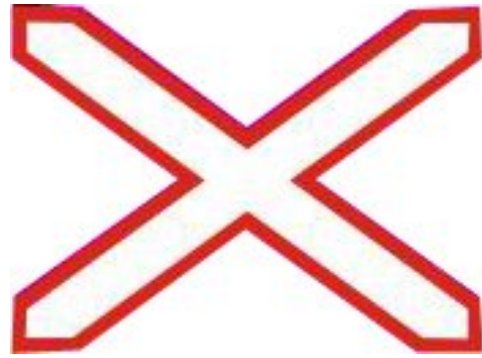
Cruce con una sola vía férrea sin barreras o semibarreras