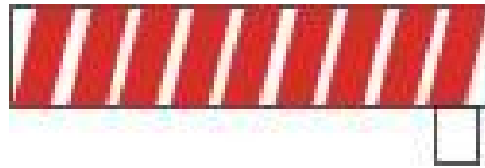
Semibarrera para los pasos a nivel