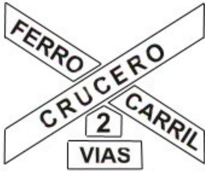
Cruce con dos o mas vías férreas sin barreras o semibarreras